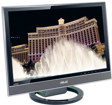
Asus LS221H: Der Monitor ist stabil, hat aber kleine Schwächen

Fazit: Der Asus LS221H ist edel, hat aber kleine Schwächen wie etwa den geringen vertikalen Blickwinkel.