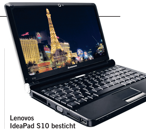
Lenovo IdeaPad S10 besticht durch eine lange Akkulaufzeit