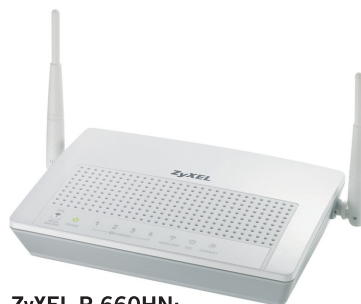
ZyXEL P-660HN: Deaktiviert auf Knopfdruck das WLAN

Fazit: Der ZyXEL-Router P-660HN ist nur durchschnittlich schnell, trumps dafür mit abschaltbarer WLAN-Funktion auf.