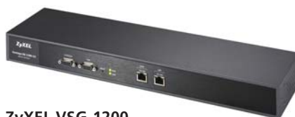
ZyXEL VSG-1200 Passerelle de service pour xDSL et/ou LAN sans fil