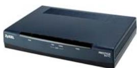
ZyXEL P-841 VDSL Ethernet Bridge