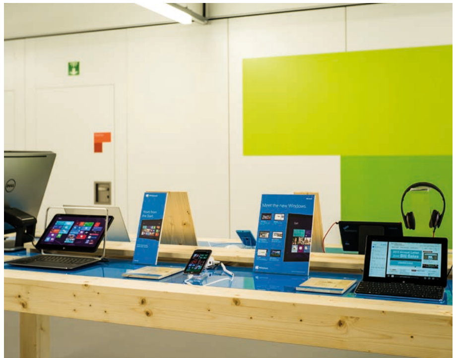
Impressionen vom WEF 2013: Netzwerk sowie WLAN für Microsoft und die Bill & Melinda Gates Foundation

Microsoft mietete für die Dauer des Forums ein Gebäude, um dort diverse Meetings mit rund 500 hochkarätigen Gästen abzuhalten und verschiedene Demos zu aktuellen Microsoft Technologien wie Surface, Kinect, Decathlon und Illumishare zu zeigen. Um die-