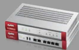
Zyxel USG40/60 UTM-Firewall mit VPN