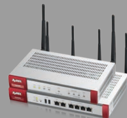
Zyxel USG40W/60W UTM-Firewall mit VPN und WLAN