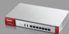
Zyxel USG110 UTM-Firewall mit VPN