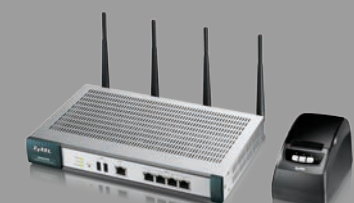
Zyxel UAG4100 & SP350E WLAN-Hotspot-Gateway mit Belegdrucker