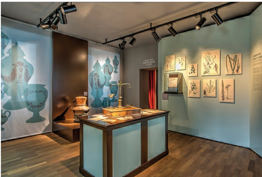
Die Verwendung des Wermutkrauts seit der Antike, vom Arzneimittel bis zur Erfindung des Getränks.

riodisch im Rechenzentrum der Valsys gesichert werden.