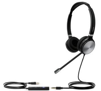
UH36 Dual Teams UH36 Dual UC