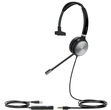
UH36 Mono Teams UH36 Mono UC

Intégration en profondeur avec les téléphones IP Yealink, pour que leurs fonctionnalités avancées, comme la synchronisation du volume et le contrôle des appels multiples soient à portée de main.